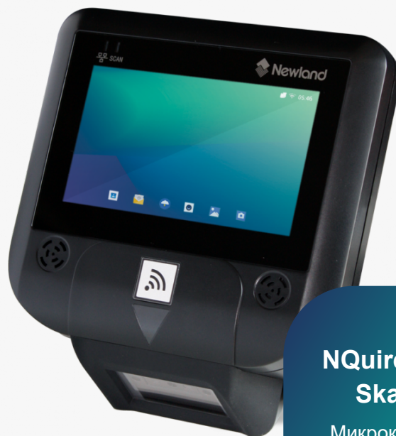
NQuire 350 Skate Микрокиоски